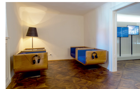
Sala de la «Novena»