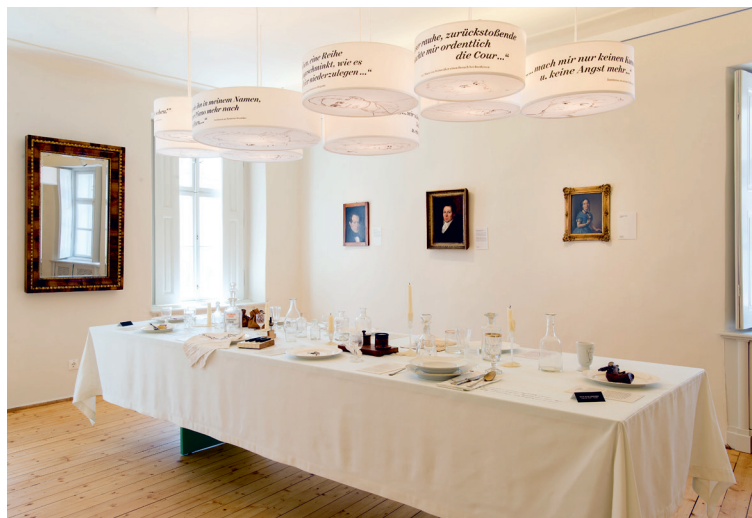
Invitado por Beethoven

En la planta baja se sitúa la tienda del museo, la cual ofrece una variada oferta en artículos y CDs de Beethoven.