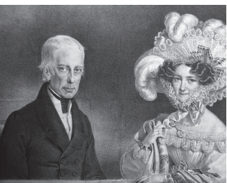
El emperador Francisco I y su esposa la emperatriz Carolina Augusta

Ludwig van Beethoven tomó curas balnearias en Baden de manera regular. En la ciudad de veraneo del Emperador Francisco I y su familia retozaba la alta aristocracia y la burguesía, entre ellos los mecenas del gran compositor. Beethoven llegó a la casa de la Rathausgasse 10 en los veranos de 1821, 1822 y 1823. En este tiempo compuso parte importante de su novena sinfonía.