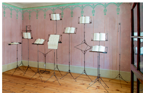
Los murales expuestos en las dependencias de Beethoven