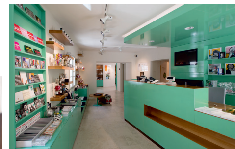
Entrada y tienda